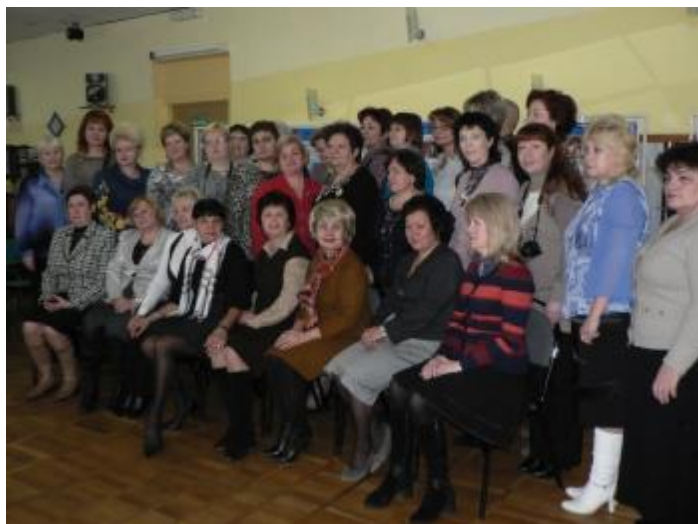
Всероссийский научно - практический семинар «Проектирование муниципальных программ развития дошкольного образования» сентябрь, 2012г. Кабардинка